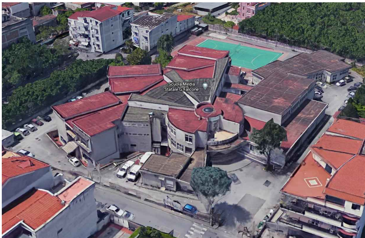
Scuola Media Statale G. Falcone

Finanziato dall'Unione europea NextGenerationEU