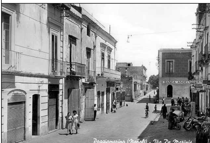
Poggiomarino (Napoli) - Via De Marinis

FASE DI ELABORAZIONE: STUDIO DI FATTIBILITA' TECNICA ED ECONOMICA COMMITTENTE: COMUNE DI POGGIOMARINO