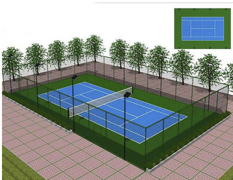
RENDERING CAMPO DA PADDLE

FINIMENTI E ATTREZZATURE DA GIOCO: tracciamento delle linee da gioco di larghezza cm 5; pali più rete divisoria per campo da tennis nonché una sedia per l'arbitro e n.2 sedute da campo.